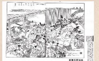
(枇杷島の青物市場)

写真は、「尾張名所図会」が描く「枇杷島の青物市」の様子です。枇杷島橋の西あたりで、柳街道の起点となった場所です。38軒の青物市問屋が並ぶ問屋町です。尾張を始め、美濃・三河・伊勢・駿河・京・大阪の産物が、毎朝山をなし買い出しの商人でごった返したそうです。現在、この地に絵図の右側に見える大根をかついだハチマキ男の像が建っています。(西春日井郡西枇杷島町)